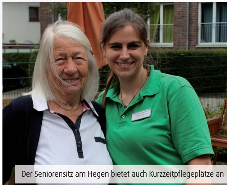
Der Seniorenstz am Hegen bietet auch Kurzzeitpflegeplätze an

Hilfe von außen anzunehmen, kann vor Überforderung schützen. Professionelle Pflege in einer Senioreneinrichtung ist eine gute Alternative. Deshalb empfiehlt es sich, den gesetzlichen Anspruch einer Kurzzeitpflege in Anspruch zu nehmen und sich als Angehöriger einmal eine „Auszeit“ zu gönnen, damit körperliche und seelische Belastungen nicht zu einem Risiko werden. Der Seniorenstz am Hegen in Hamburg-Rahlstedt bietet diese professionelle Hilfe an und hält auch Kurzzeitpflegeplätze vor.