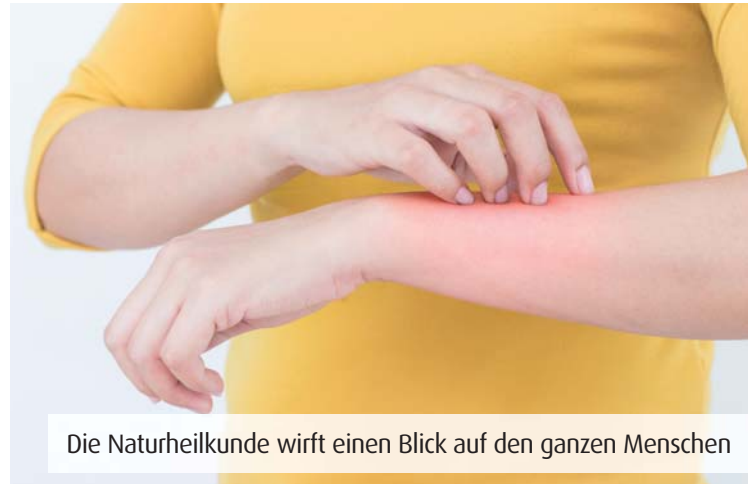
Die Naturheilkunde wirft einen Blick auf den ganzen Menschen

• Im Volksmund wird die Haut gern als „Spiegel der Seele“ bezeichnet, sie kommuniziert z.B. über die Schamesröte oder die Blässe vor Schreck.