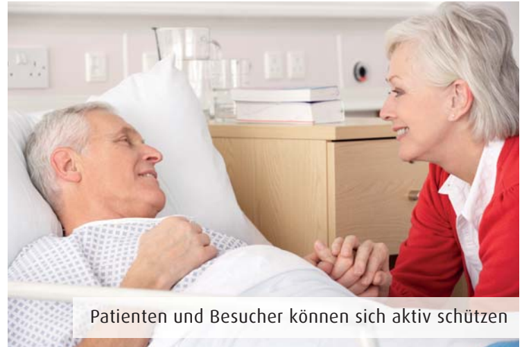
Patienten und Besucher können sich aktiv schützen

Die meisten Infektionen werden über die Hände übertragen. Die wichtigste Maßnahme lautet daher für Patienten wie für Besucher: regelmäßiges und gründliches Händewaschen. „Zudem ist es sinnvoll, die Hände in bestimmten Situationen zu desinfizieren: beim Betreten und Verlassen des Patientenzimmers, vor dem Essen, nach der Toilette und vor und nach dem Kontakt mit der eigenen Wunde“, sagt Dr. Schenkel. Nutzen Sie die Desinfektionsmittel, die in Spendern auf den Krankenhausstationen zur Verfügung stehen.