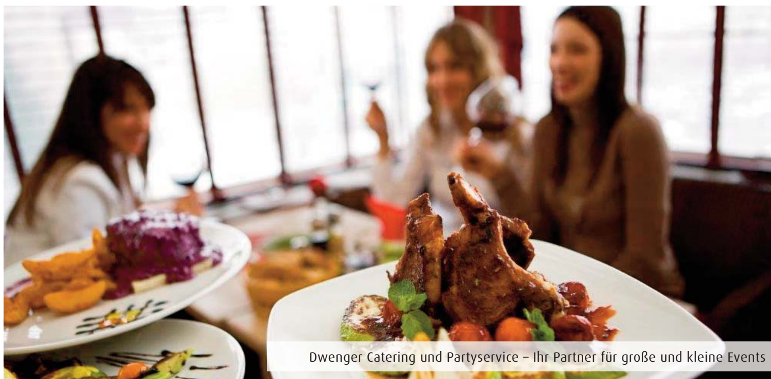
Dwenger Catering und Partyservice – Ihr Partner für große und kleine Events

Partyservice Dwenger GmbH Merkurring 38-40 22143 Hamburg Tel. 040/ 675 986-0 www.dwenger.de