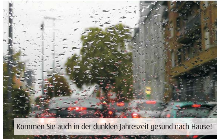
Kommen Sie auch in der dunklen Jahreszeit gesund nach Hause!

zeughalter sollten die Auto-scheiben außen und innen gründlich reinigen und gegebenenfalls die Wischerblätter der Scheibenwischer erneuern. Weisen die Scheiben keinen Schmierfilm auf, kann das Luftgebläse sie außerdem viel schneller wieder von Kondenswasser und Eis befreien.