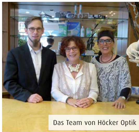
Das Team von Höcker Optik