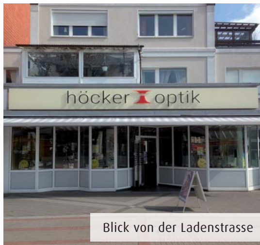
Blick von der Ladenstrasse

Höcker Optik GmbH Rahlstedter Bahnhofstraße 19 22143 Hamburg Tel.: 040 - 677 9448